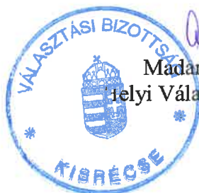
Madariné Török Tünde Helyi Választási Bizottság elnöke

A határozat a választási eljárásról szóló 2013. évi XXXVI. törvény 162. §, valamint a jogorvoslatról való tájékoztatás a választási eljárásról szóló 2013. évi XXXVI. törvény 240.§-án alapul.